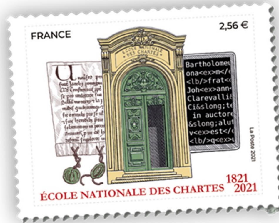
Timbre émis en 2021 pour le bicentenaire de l'École Nationale des Chartes