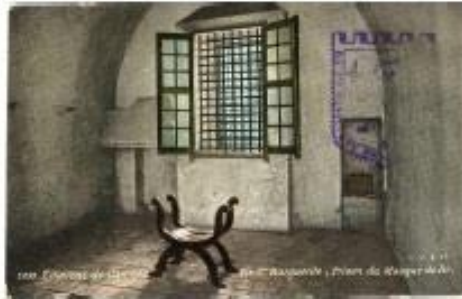
Cellule du Masque de fer, Arch. mun. de Cannes, 40F1133

L'atelier se déroule en deux séances qui allient théorie et pratique, autour de la justice sous l'Ancien Régime. Dans un premier temps, la notion de crime et les conditions d'enfermement sous la monarchie absolue sont présentées aux élèves.