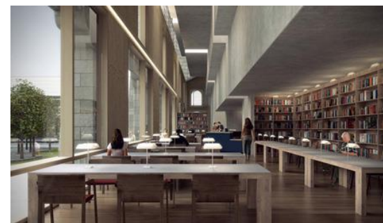
Vue intérieure – image de synthèse