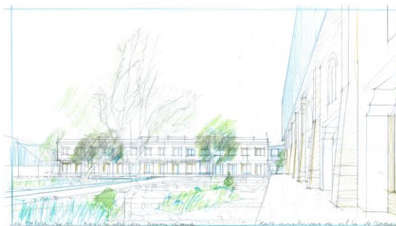
après dessin et image de synthèse : ©Robbrecht en Daem Architecten