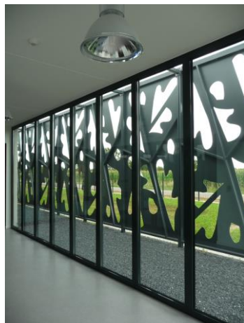
Le brise soleil vu de l'intérieur

SHON 580 m 2 - Surface Utile : 450 m 2 .