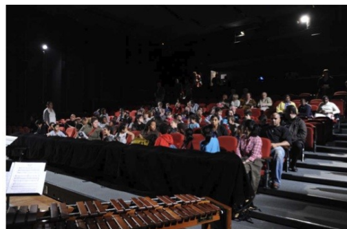
Grand Dire 2012 - Spectacle Er-Töshtück