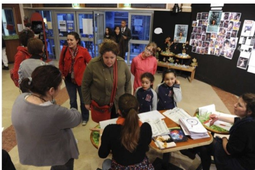
Grand Dire 2012 - Spectacle Er-Töshtück