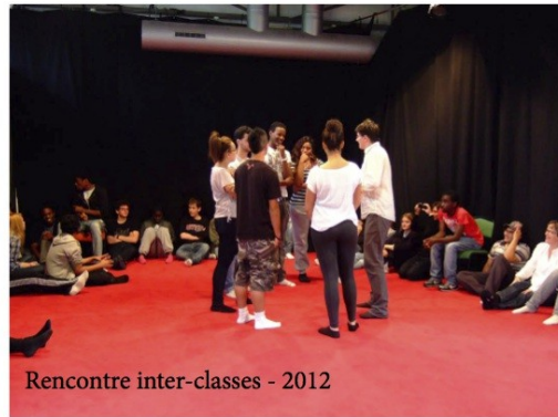
Rencontre inter-classes - 2012