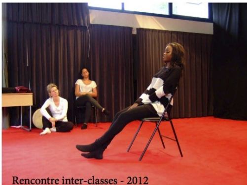
Rencontre inter-classes - 2012