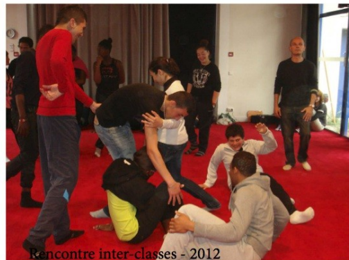
Rencontre inter-classes - 2012