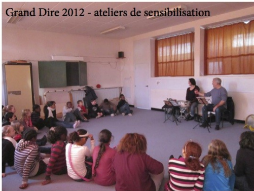
Grand Dire 2012 - ateliers de sensibilisation