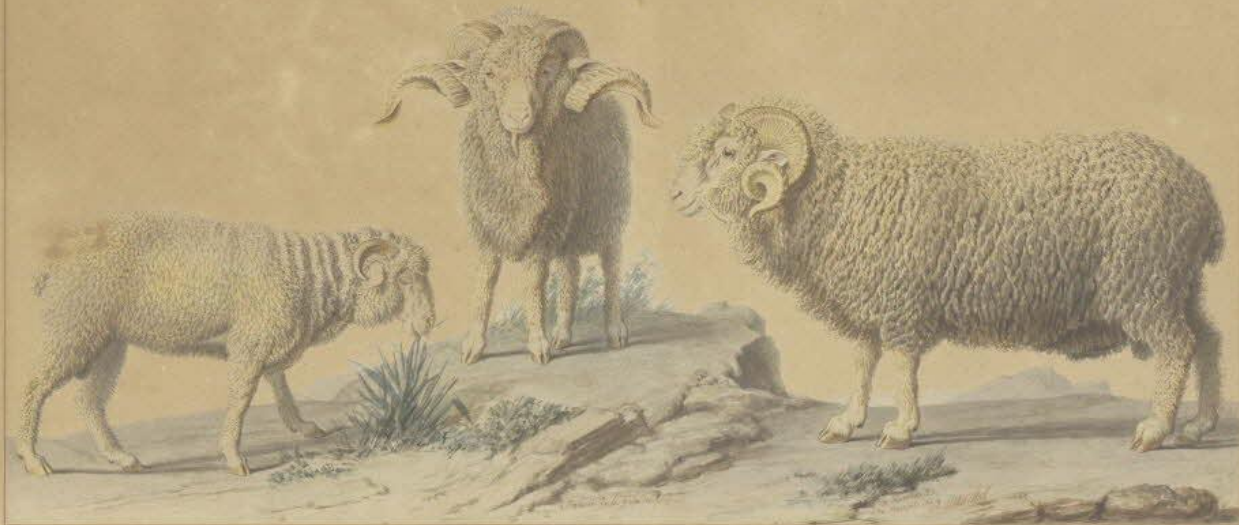
Merinos mâles, nés à Rambouillet, L. à 10 e Année de l'importation faite en 1786.