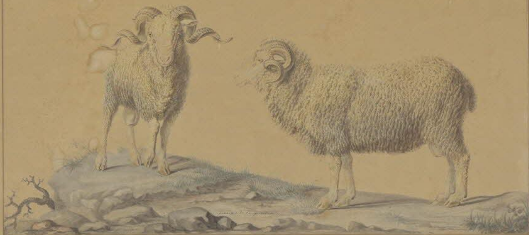
Merinos mâles, nés en Espagne et nouvellement importés en France.