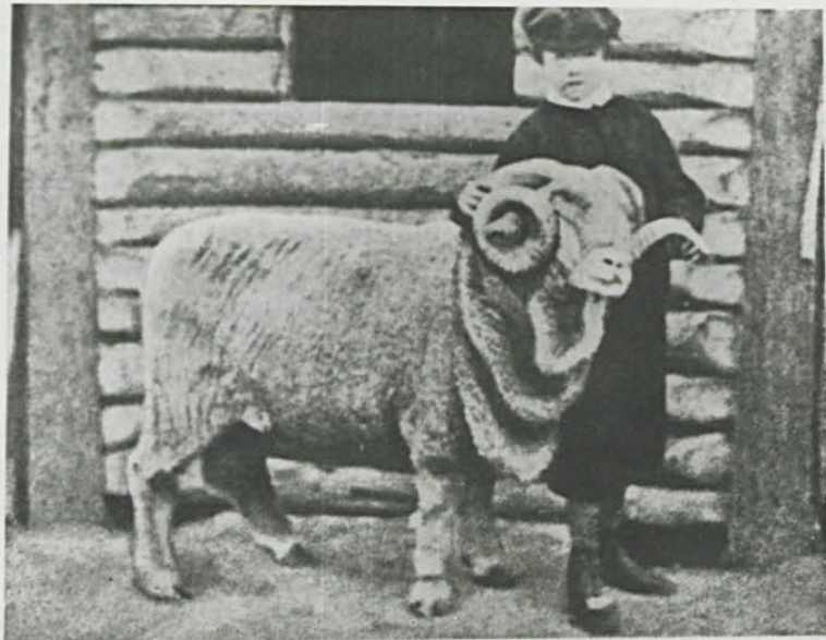
EMPEROR A RAMBOUILLET RAM, IMPORTED IN 1865