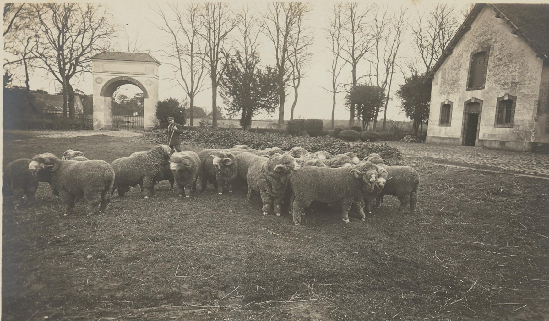
Béliers âgés de 27 mois (134 e G on ) Rambouillet