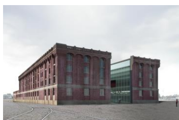
Le projet et sa rue intérieure