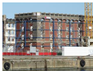
En travaux © Angelo Blondeel