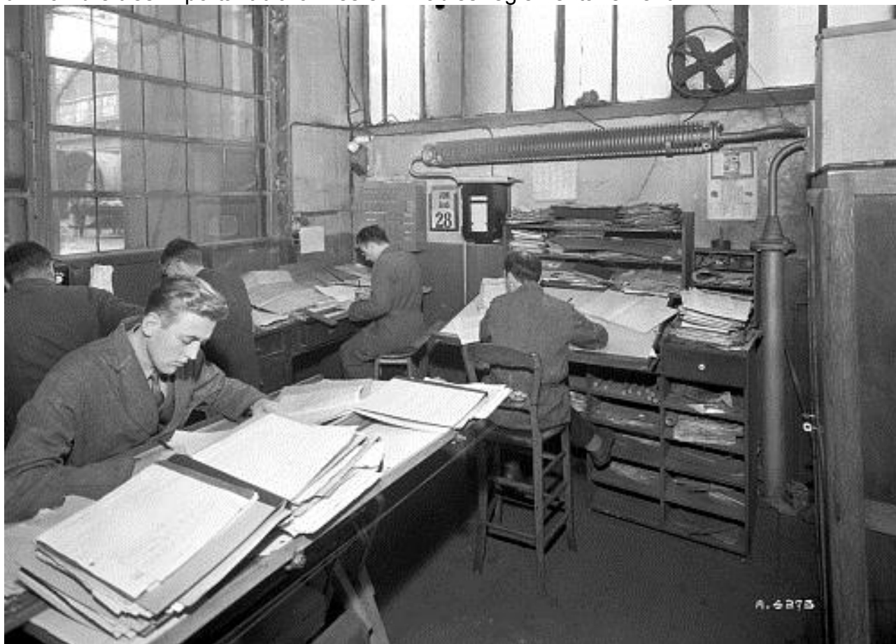
Fonds Fives Cail. ANMT. 94 1. NC.

Des chantiers de réévaluation seront programmés. La priorité sera donnée aux fonds les plus volumineux qui, en l'absence d'une politique d'évaluation/sélection au moment de la collecte, représentent des masses d'archives dont une partie aurait dû être éliminée avant l'entrée aux ANMT. C'est le cas du fonds de Framatome (4 kml) pour lequel le producteur proposait une élimination à hauteur de 90 %. Il conviendra de reprendre contact avec ce producteur pour valider en commun les critères de sélection. Une réflexion devra être également menée pour les archives de Charbonnages de France (2 kml) et celles de GDF (1,3 kml) dont les bordereaux de versement aux analyses aléatoires et laconiques révèlent un nombre très important d'archives éliminables réglementairement.