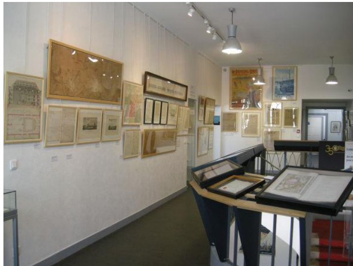
Illustrations : les magasins et une exposition temporaire : les 350 ans de Lorient

Page 1 : texte de la publication du SIAF « Les archives dans la Cité » parue en juin 2013. Rédaction : le service des Archives municipales et France Saïe-Belaïsch.