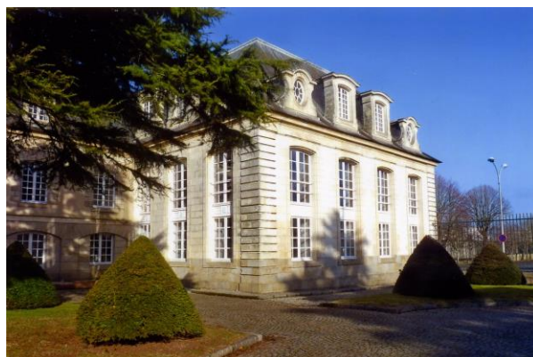
Cour intérieure de l'Hôtel Gabriel

Capacité de conservation : 1,7 kml dans 6 magasins d'une surface variant de 22 à 50 m 2 pour un total de 217 m 2 .