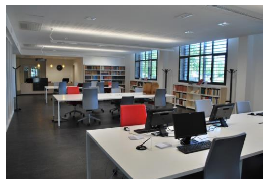
La salle de lecture