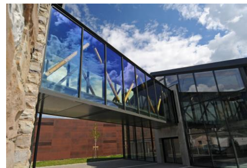
La façade

Rédaction le service des Archives municipales et France Saïe-Belaïsch.