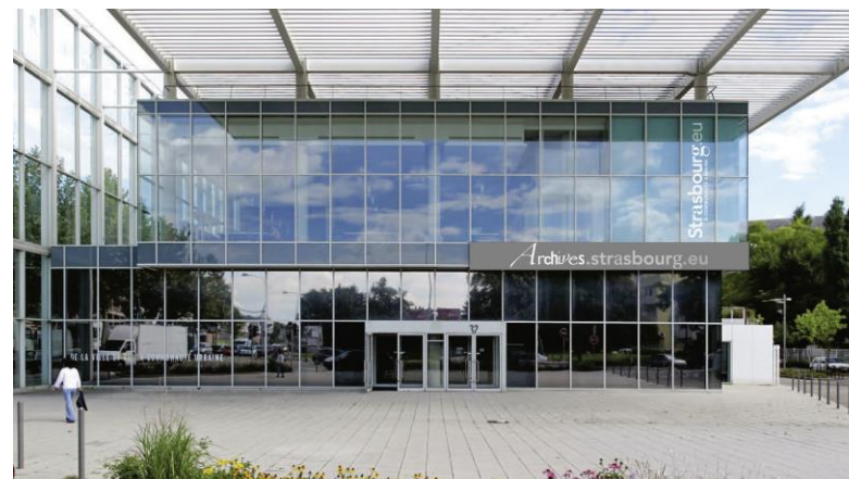
L'auvent d'aluminium - architecté blanc - en noir 50%

Les Archives de Strasbourg s'étirent d'Ouest en Est le long de la route du Rhin, qui doit devenir un boulevard urbain. La façade Ouest, largement vitrée, est surplombée par un auvent avec un porte-à-faux de 10 mètres au-dessus d'un parvis. Elle marque les espaces accessibles au public. Les bureaux sont placés au Sud, à l'intérieur de la parcelle, aux deuxième et troisième étages. Le bloc des magasins, revêtu d'aluminium laqué blanc, s'élève sur 4 étages. Il est séparé par un patio, accessible au public, des locaux d'accueil du public. En raison de la proximité de la nappe phréatique (zone inondable par remontée de nappe), il n'y a pas de magasin enterré.