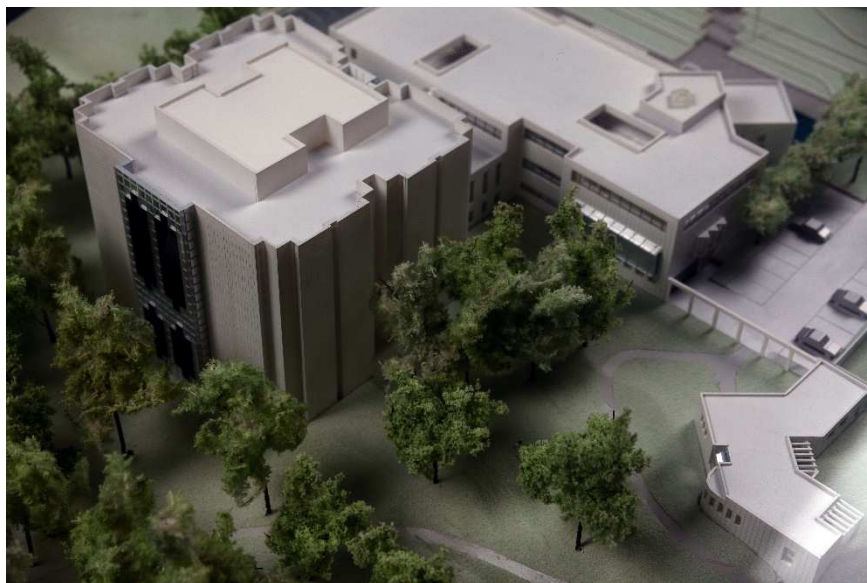
Maquette du bâtiment de la direction des Archives départementales