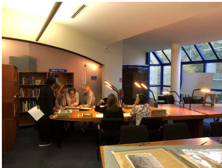
Atelier d'initiation à la recherche en salle de lecture.

On peut se réjouir du succès inentamé des cours de paléographie, de la mise en place d'ateliers d'initiation à la recherche et de la diffusion en ligne de fiches d'aide méthodologique (révisées en avril 2020).