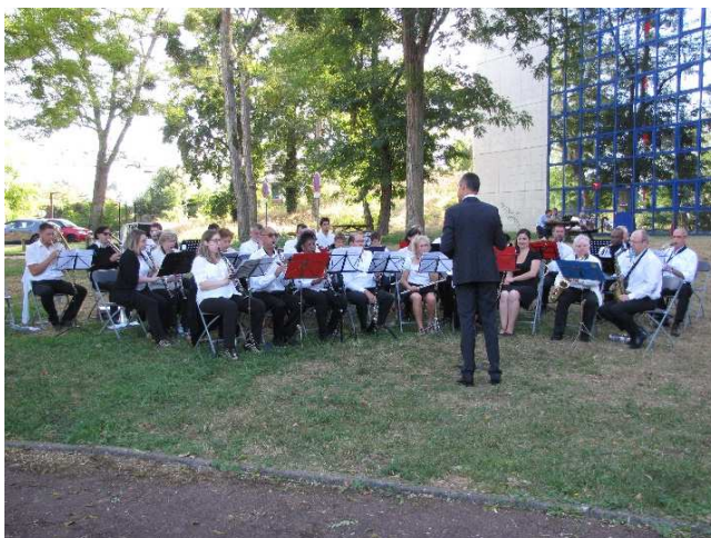
Concert de l'Orchestre d'harmonie de Melun dans le cadre des Journées européennes du Patrimoine.