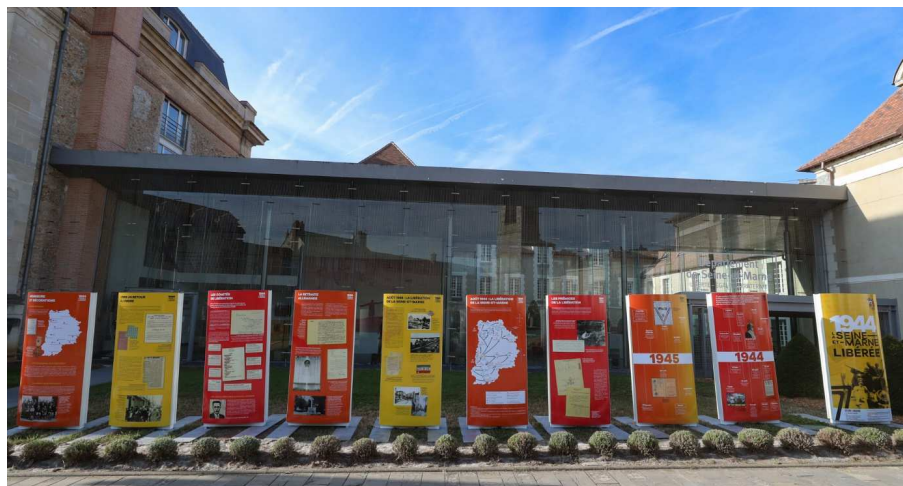
Commémorations du 75 e anniversaire de la Libération du département (14 septembre 2019)