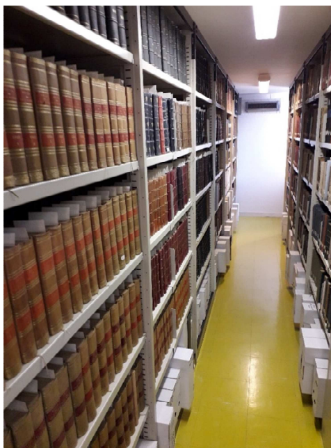
Bibliothèque des Archives de Seine-et-Marne

Dans le cadre du chantier des collections, il est envisagé une campagne ciblée de désherbage, accompagnée d'un reconditionnement d'un certain nombre d'ouvrages présentant un caractère patrimonial (XVII e -XVIII e s.). On saisira également l'opportunité de l'évolution vers 'Advance Archiv' pour faciliter le travail de diffusion et d'intégration des notices de bibliothèque.