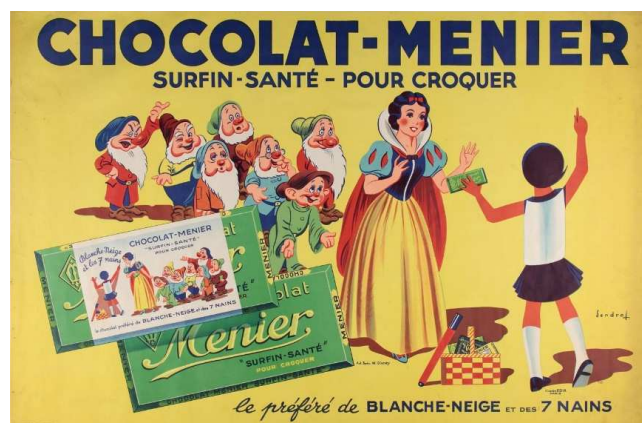
Affiche des chocolats Menier (17 Fi 541)

Ce domaine spécifique concerne la presse et les périodiques locaux, les ouvrages imprimés de la bibliothèque, les mémoires universitaires ainsi que les documents iconographiques (cartes, plans, photographies, cartes postales et affiches). Le travail réalisé dans ce secteur a permis de mieux cibler les documents susceptibles d'être collectés : affiches et cartes postales en lien avec des institutions emblématiques du département, affiches en lien avec des manifestations d'intérêt seine-et-marnais. On poursuivra ce travail en donnant la priorité au classement sur la collecte, pour ne pas acquérir de documents faisant doublon (arriéré de cartes postales notamment).