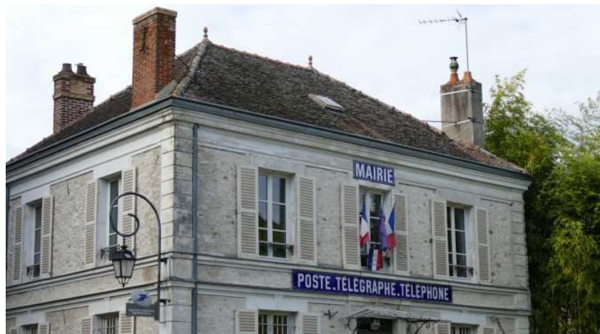
Mairie de la commune de Féricy

L'objectif est de reprendre l'historique des études notariales grâce à une reprise de la filiation des notaires et à un contrôle des périodes considérées jusqu'alors comme lacunaires. Il conviendra de revoir les relations établies avec le Centre de gestion de la fonction publique territoriale, pour un meilleur suivi des archives communales