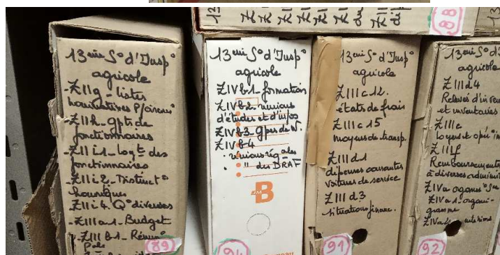
Collecte d'archives auprès du Centre hospitalier de Fontainebleau Visite réalisée auprès des services de la DIRECCTE

Ces orientations seront développées à travers les axes de travail suivants :