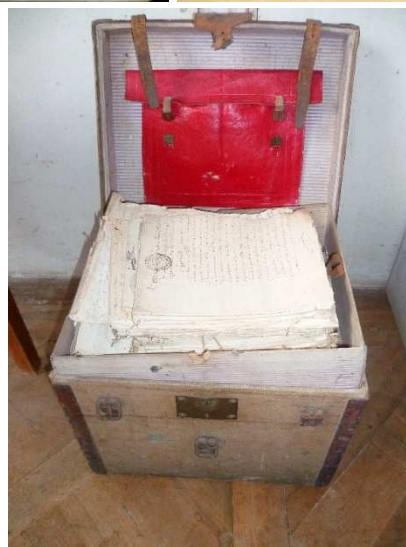
Carnets de route du soldat René Fichu (J 1314)