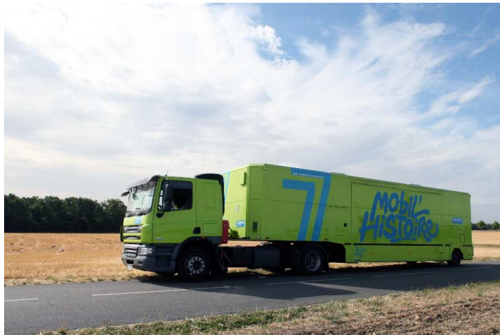
Le Mobil'Histoire 77