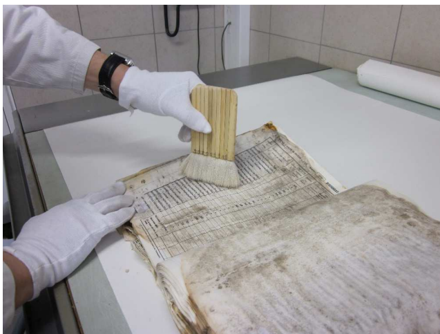
Dépoussiérage manuel de documents dans le cadre du traitement de la crise sanitaire