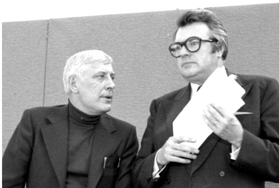
Robert Pontillon et Pierre Mauroy au Congrès extraordinaire de Dijon – mai 1976.