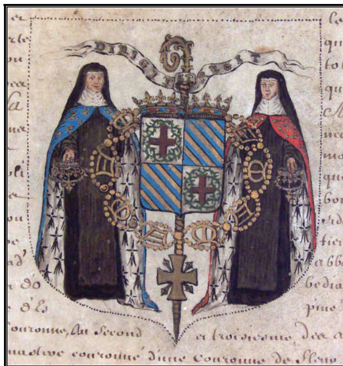
Armes de l'abbaye Saint-Amand (1662)