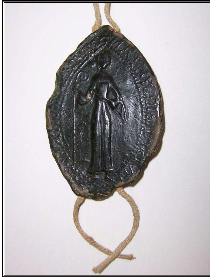
Sceau de l'abbesse Mathilde (XIII e siècle)